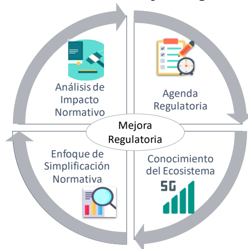
Gráfico 2. Pilares de Mejora Regulatoria